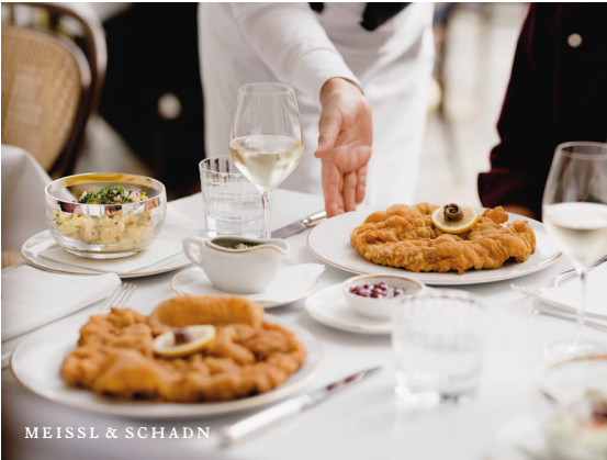
MEISSL & SCHADN