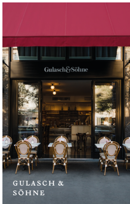
GULASCH & SÖHNE