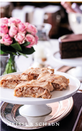
MEISSL & SCHADN