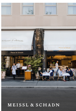
MEISSL & SCHADN