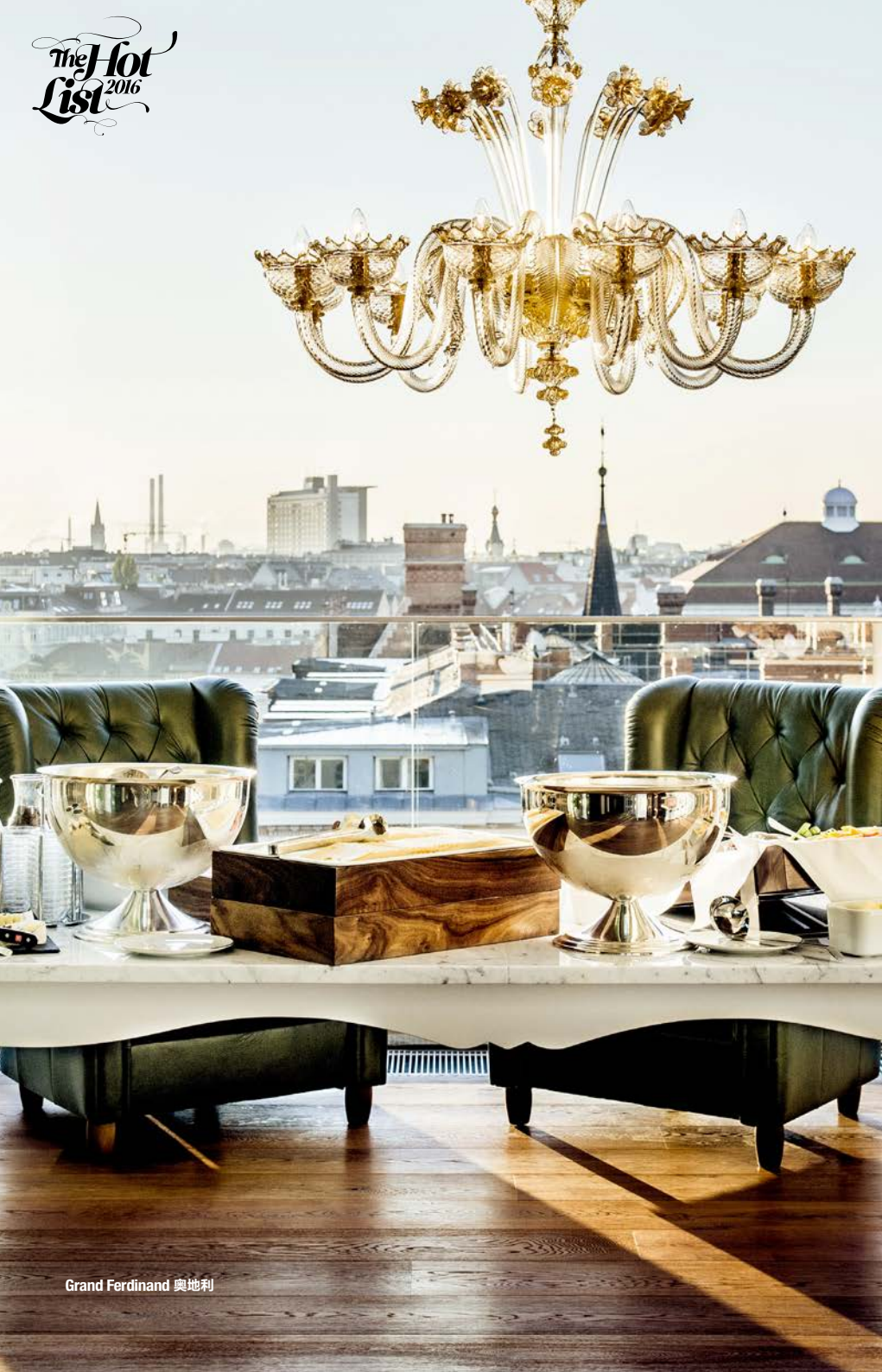
Grand Ferdinand 奥地利