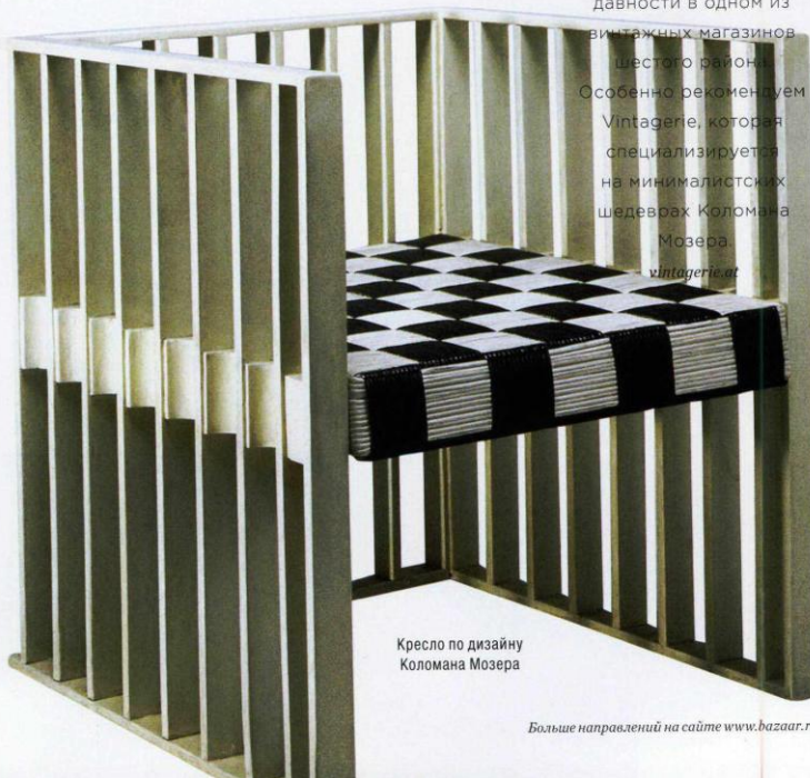
Кресло по дизайну Коломана Мозера

дизайнерскую диковинку столетней давности в одном из винтажных магазинов шестого района. Особенно рекомендуем Vintage.ru, которая специализируется на минималистских шедеврах Коломана Мозера vintage.ru