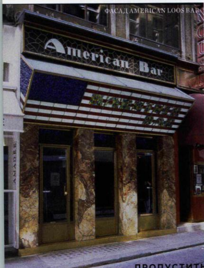
ФАСАД AMERICAN LOOS BAR