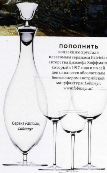
Сервиз Patrician, Lobmeyr